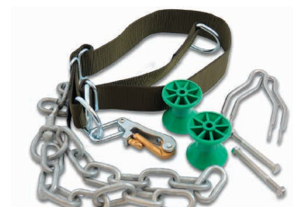
Jeu de collier nylon vert DK Art. 200720