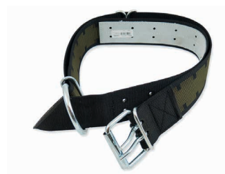
Collier pour taureaux 70 mm avec boucle Art. 203893