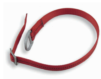
Demi-lien avec anneau simple Art. 200710