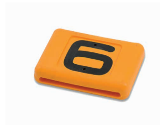
Plaque pour collier 50 mm Art. 200731