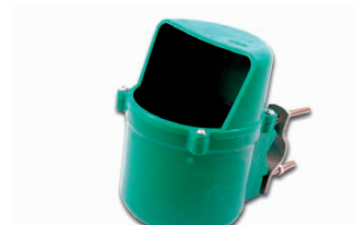
Bac à sel Kroni complet Art. 200782