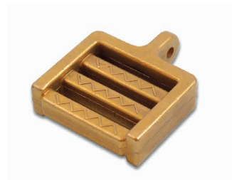
Poids en laiton pour collier nylon Art. 200747