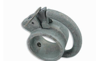
Bride avec crochet Art. 200521