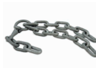
Haîne d'attache version lourde, 10 mm Art. 205447