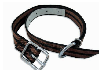
Collier polyester réglable 135 x 4 cm Art. 203356