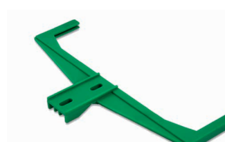
Cadre pour panneau, vert Art. 200775