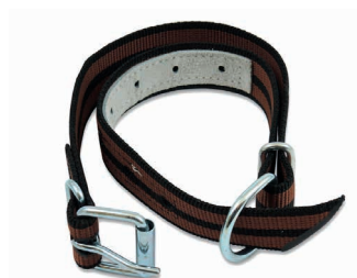
Collier nylon pour jeune bétail avec boucle Art. 200739