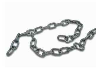
Chêne d'attache Art. 200692