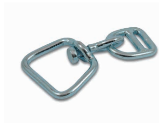
Touret pour collier et demi-lien Art. 200713