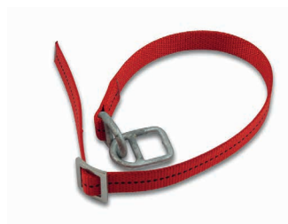
Demi-lien avec anneau double Art. 200712