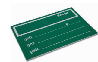
Panneau Krieger, 25.9 x 18.1 cm, vert Art. 200773