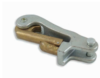
Mignon petit / grand avec rivet Art. 204336 / 204337