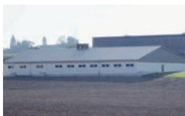
Markus Stocker 5645 Aettenschwil AG