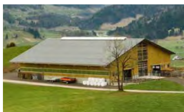
Wendelin Emmenegger 6170 Schüpfheim LU